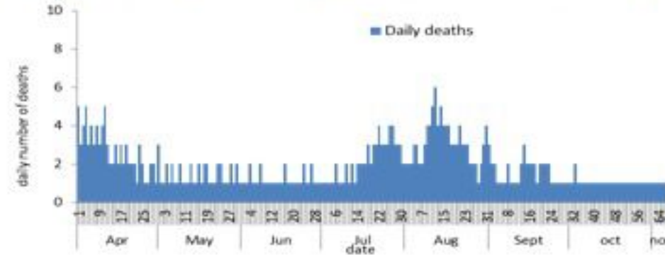
عدد الوفيات حسب اليوم

سيتم التركيز على المؤشرات الخاصة بالحالات الشديدة. في الأيام 7 الأخيرة، تم تسجيل 7 وفيات (0.13 لكل مئة ألف). وبلغت نسبة احتمال اسرة العداية الفائقة 6% (11 أسرة من اصل 182). اما نسبة إيجابية الفحوصات المحلية فقد بلغت 5.3%. ويصنف التفشي المجتمعي على مستوى 2.