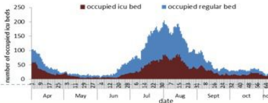
عدد الاسرة المستعملة